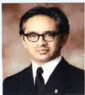
マルティ・ ナタレガワ インドネシア 前外務大臣