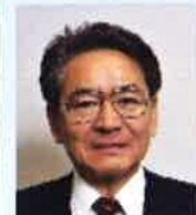
緒方 靖夫 日本共産党副委員長 国際委員会責任者