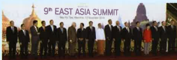
東アジア首脳会議 2014年11月

2005年から東南アジア諸国連合（ASEAN）を中心に、米国、中国、韓国、ロシア、日本など域外の主要国18ヶ国が集まり、東アジア首脳会議（EAS）が開催されています。