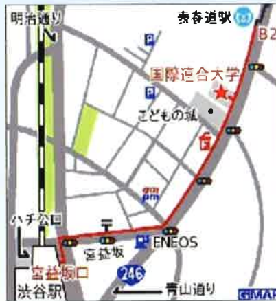
渋谷駅より会場へのご案内