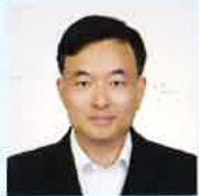
リン チェン 劉 成 南京大学教授 アジア太平洋平和 研究会評議員