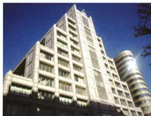
会場の国連大学（東京渋谷）

東アジア地域の人々は、緊張関係の長期存続や武力衝突あるいは戦争を避け平和共存できること、貧困や環境など山積する課題を解決し、経済・社会の発展と安定を強く望んでいます。こうした平和・協力・繁栄の東アジアを可能とするメカニズムをどのようにすればよいのか、5月24日の「国際シンポジウム」で、国際的に著名な研究者・外交関係者の方々に語り合ってください。