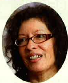
ジュディス・ルブラン ピースアクション (アメリカ)

アメリカ、フランスなど核保有国の平和運動代表や、2010年NPTニューヨーク行動を指揮した有力な運動代表、マーシャル諸島やロシアのチェリャビンスクなど核被害者の代表などが参加します。