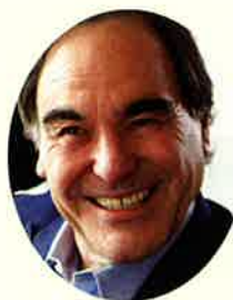
オリバー・ストーン監督

2012年に「もうひとつのアメリカ史」(10回シリーズ)を製作したオリバー・ストーン監督と、共同制作者である歴史学者のピーター・カズニック氏が原水爆禁止2013年世界大会に参加します。両氏は世界大会の中で、原爆投下の犯罪性を訴えます。オリバー・ストーン監督は、『プラトーン』、『7月4日に生まれて』、『JFK』をはじめ数々の名作を世に送り出し、2度のアカデミー賞に輝いた巨匠。「もうひとつのアメリカ史」は、最新の資料による裏づけをもってアメリカの黒歴史を暴いた歴史大作と高く評価されています。