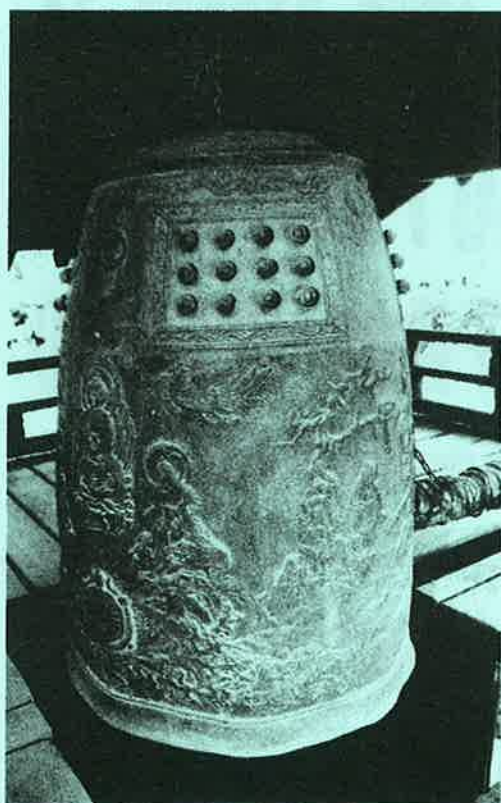
軍の徴用を免れた梵鐘(国清寺)