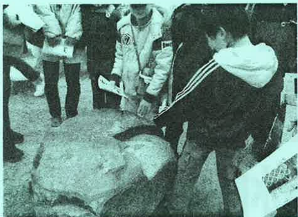
天守閣の焼けた礎石を見る子どもら